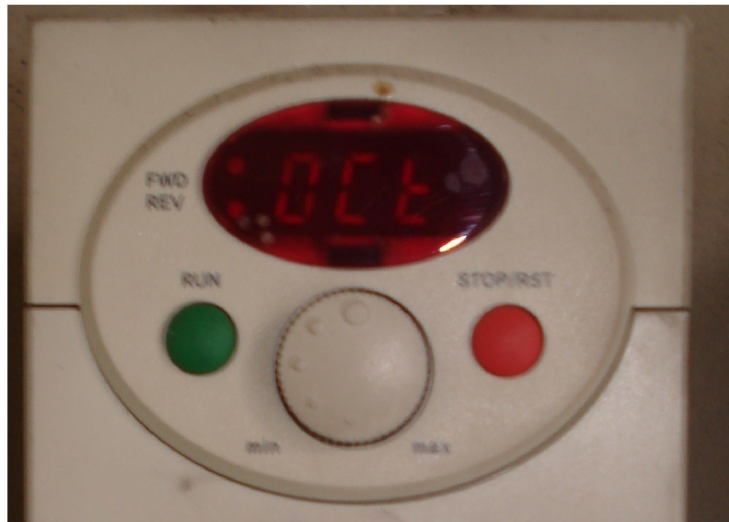
Zdj. Nr 2