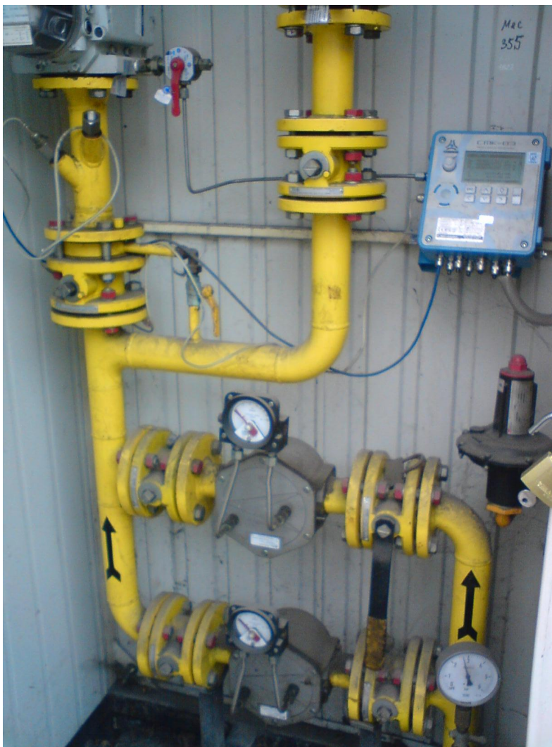
Zdj. Nr 1 – stacja redukcyjno-pomiarowa dla Pawilonu C'

Stacja przeznaczona do redukcji gazu z zakresu średniego do ciśnienia niskiego oraz pomiaru natężenia przepływu gazu. Posiada zestaw pomiarowy z gazomierzem. Układ redukcyjny składa się z dwóch równoległych ciągów: czynnego i rezerwowego.