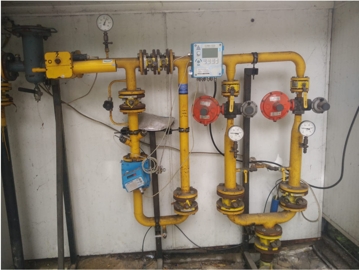
Zdj. Nr 2 – stacja redukcyjno-pomiarowa w Szp. przy ulicy Bony 1/3