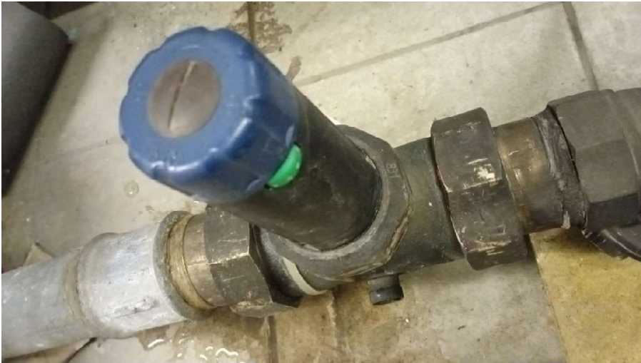
Zdj. nr 3 Reduktor ciśnienia

b). Reduktor ciśnienia (w instalacji doprowadzającej zimną wodę do wymiennika ciepłej wody użytkowej)