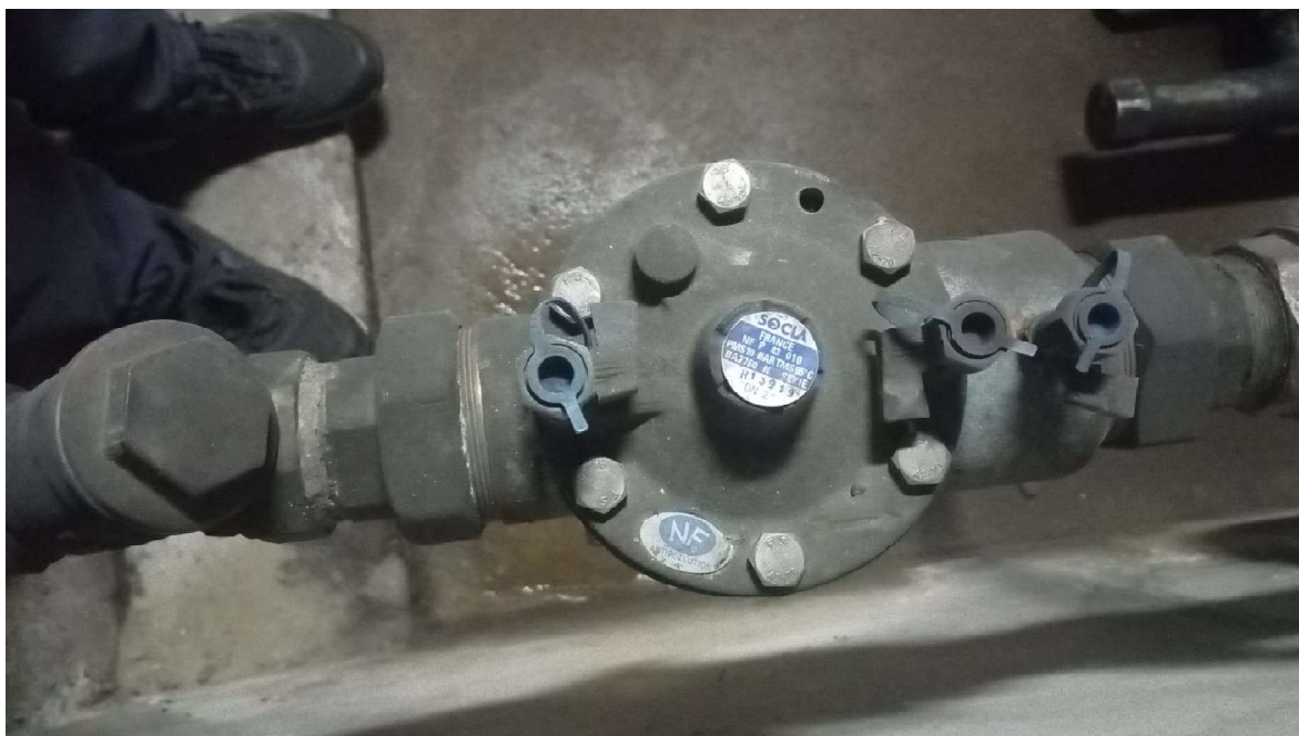
Zdj. nr 1 Zawór antyskażeniowy SOCLA

a). zawór antyskażeniowy typ SOCLA (dane techniczne zdjęcie poniżej) (na zasilaniu zimnej wody użytkowej w Szpitalu)