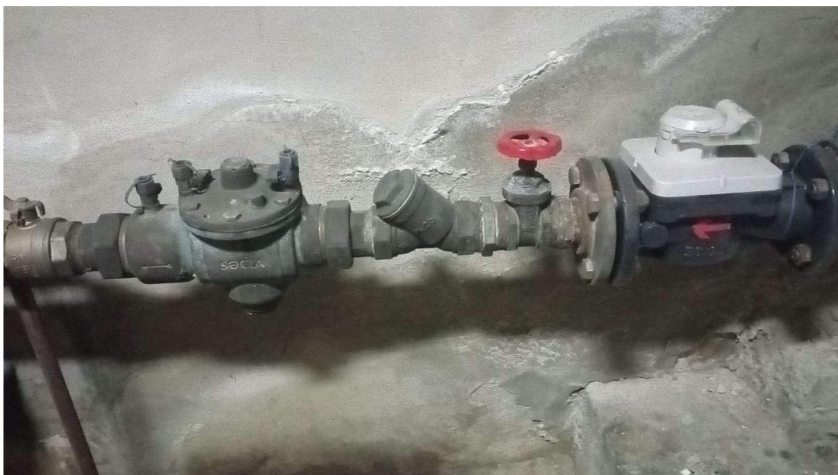
Zdj. nr 2 Zawór antyskażeniowy SOCLA